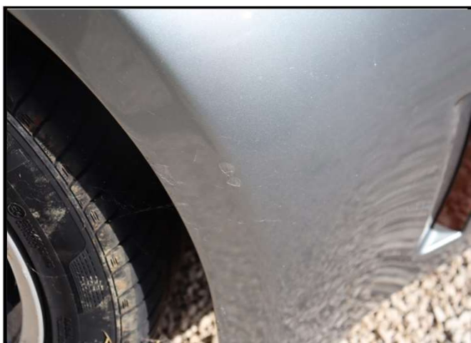
Ogreban branik prednji