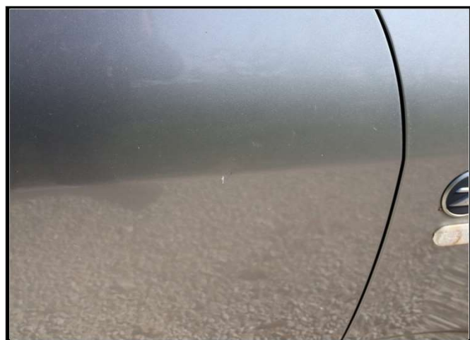
Ogrebana vrata desna