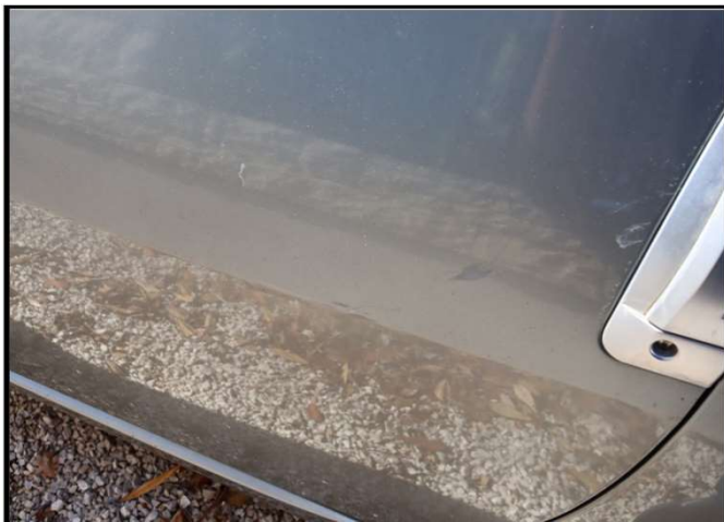
Oštećenja vrata lijevih