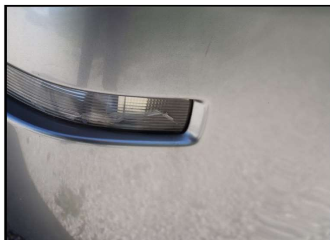
Oštećen smjerokaz stražnji desni