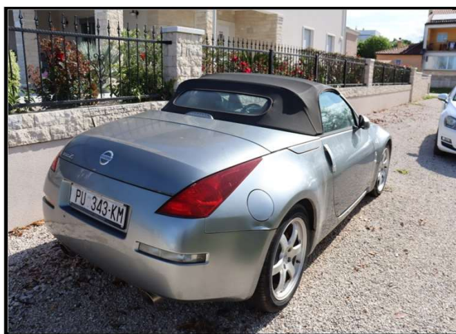
Udubljena bočne stijena stražnja desna