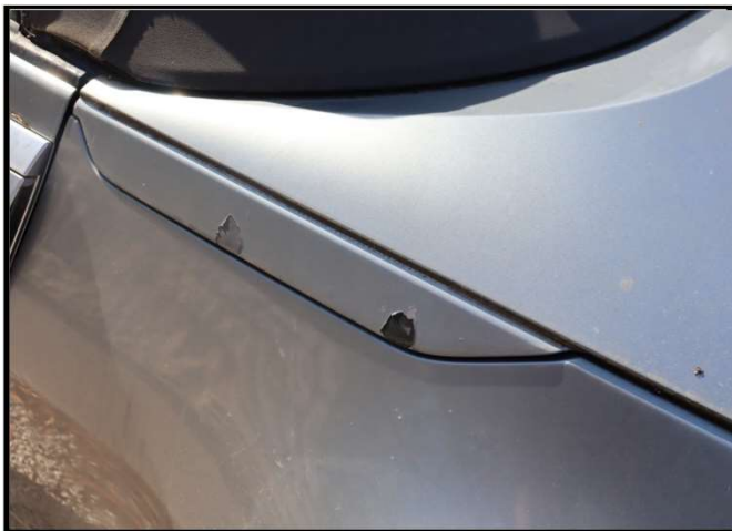
Oštećenje bočne stijene stražnje lijeve