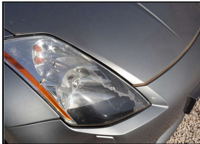
Otpadanje bezbojnog laka reflektora desnog